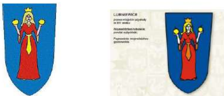
Współczesne wersje herbu Lubniewic ze stron www.Lubniewice i wydawnictwa Herby miast polskich

Współcześnie stosowany herb miejski posiada również nie proporcjonalnie wydłużoną tarczę herbową. Zgodnie z sugestiami Komisji Heraldycznej przy MSWiA współczesne samorządy powinny przedstawiać swoje herby na tarczy tzw. hiszpańskiej zaokrąglonej owalnie u podstawy. Przekształcenie trójkątnej tarczy gotyckiej zastosowanej w projekcie W. Dworzaczka spowodowało również utratę proporcji w przypadku postaci kobiety.