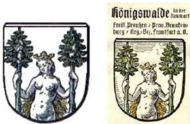
Herb Lubniewic w wersji Ottona Huppa z 1898 r. z pracy Die Wappen und Siegel der deutschen Städte, Flecken und Dörfer, Königreich Preussen, Bd I, Heft 1, Ostpreussen, Westpreussen und Brandenburg ( z lewej) oraz jako naklejka do albumu ( z prawej)

W XIX wieku na pieczęciach miejskich wizerunek kobiety został zamieniony w postać dziecka przedstawianego między dwoma drzewami. Owa zamiana uznana została przez niemieckich heraldyków za błędną ze względu na przedstawienie postaci dziecka bez rąk, które przesłonięte zostały drzewami.